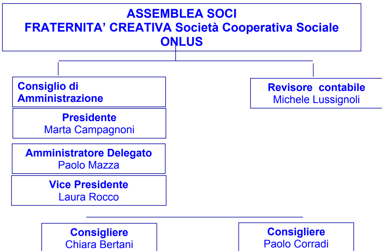
Figura 1 - Organigramma cooperativa

La cooperativa Fraternità creativa è organizzata come riportato nell'organigramma seguente